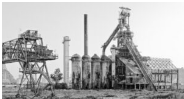
Ex Italsider Bagnoli

Come, poi, dimenticare Gela, dove crisi del petrolio e concorrenza mondiale hanno messo in ginocchio la raffineria dell'Eni, laddove dei 10 mila dipendenti degli anni '90 oggi ne restano 2 mila tra diretti e del sistema indotto, molti dei quali in cassa integrazione; ed il fallimento della Belleli a Taranto il cui unico risultato è stato la cassa integrazione e l'accompagnamento alla quiescenza degli oltre 2mila dipendenti, tra diretti e indiretti, e solo per una piccola parte di questi la ricollocazione nello stabilimento ex-Ilva.