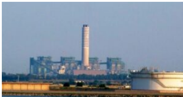
Centrale Enel Brindisi

E allora, prima di rottamare qualcosa sarà necessario attrezzarsi innanzitutto con una visione condivisa di modello sociale, economico e produttivo per non privarci di ulteriori settori produttivi ed ulteriore occupazione.