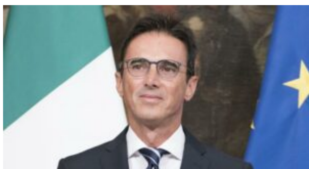
Sen. Mario Turco

La Clausola sociale premiale sottoscritta tra Governo, rappresentato dal Sottosegretario alla Presidenza del consiglio Sen. Mario Turco e Parti sociali ioniche, nel contesto del Contratto Istituzionale di Sviluppo (Cis) Taranto, può e deve costituire opportunità irripetibile, non solo per 'definire procedure volte a favorire l'impiego di lavoratori provenienti dai bacini di crisi delle aziende dei complessi industriali di Taranto' ma anche per rappresentare occasione utile al rilancio dell'imprenditorialità ionica, alle prese anch'essa con le ricadute dirette e indirette determinate dalle molteplici criticità che hanno coinvolto le realtà produttive del territorio: è quanto sostenuto da Francesco Solazzo stamani nella videoconferenza convocata dal Prefetto di Taranto Dott. Demetrio Martino , avente per oggetto l'incontro con le Stazioni appaltanti del Cis Taranto sulla Clausola sociale premiale, cui ha partecipato lo stesso Sen. Mario Turco , Sottosegretario di Stato alla Presidenza del Consiglio dei ministri.